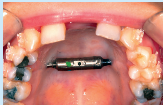
Smile Distraktor im Einsatz.