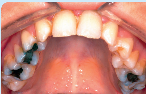
Vor der Weitung.

Drehen Sie um ein Viertel bis sich das nächste Stiftloch zeigt. Machen Sie das zweimal täglich.