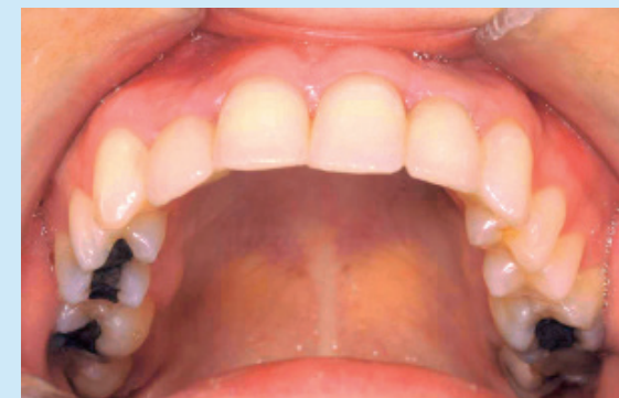
Sechs Monate nach der Weitung.